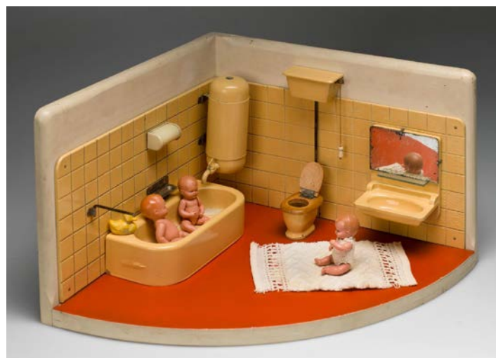
PUPPENECKBADEZIMMER, 1930ER JAHRE