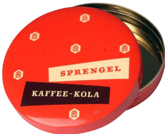
BLECHDOSE „SPRENGEL KAFFEE-KOLA“, NACH 1952

Vorsitzende der Freunde des Historischen Museums Hannover e.V.